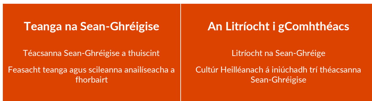
Fíor 3 Struchtúr snáithe i sonraíocht na Sean-Ghréige

Cuirtear sonraíocht Shean-Ghréigise na hArdteistiméireachta i láthair in dhá shnáithe a bhfuil dhá ghné lárnacha ag gach ceann acu: