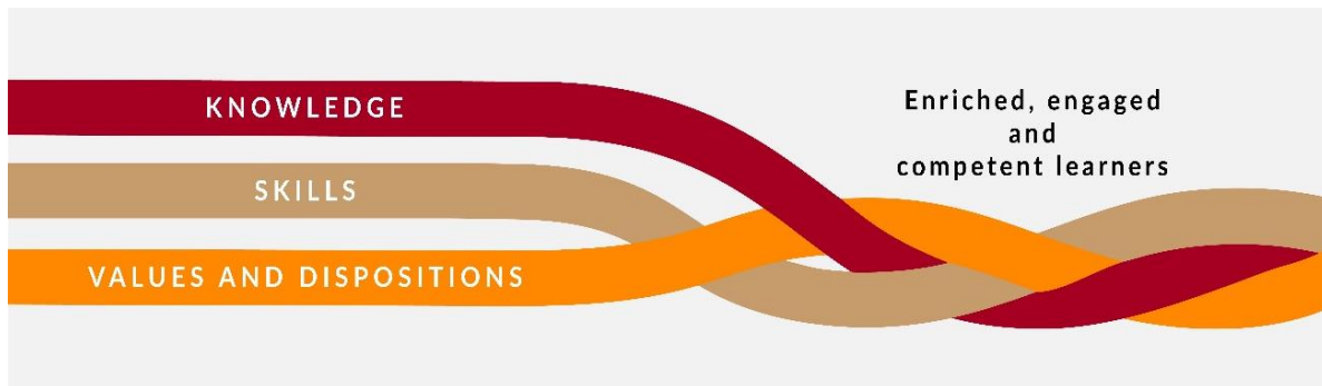
Fíor 1 Comhpháirteanna na príomhinniúlachtaí agus an tionchar inmhianaithe atá acu

Scáth-théarma is ea na príomhinniúlachtaí 1 a thagraíonn don eolas, scileanna, luachanna agus meonta a fhorbraíonn an scoláire le linn na sraithe sinsearaí.