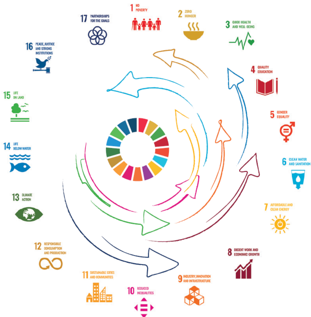
Fíor 1 - Spriocanna Forbartha Inbhuanaithe (EOECNA, 2020, lch 12)

4 - Oideachas ar Ardchaighdeán. Tá líon spriocanna i gceist agus Sprioc 4.7 dírithe ar OFI. Tá sé aitheanta nach féidir SDGanna a bhaint amach gan daoine a chur ar an eolas faoi fhorbairt inbhuanaithe.