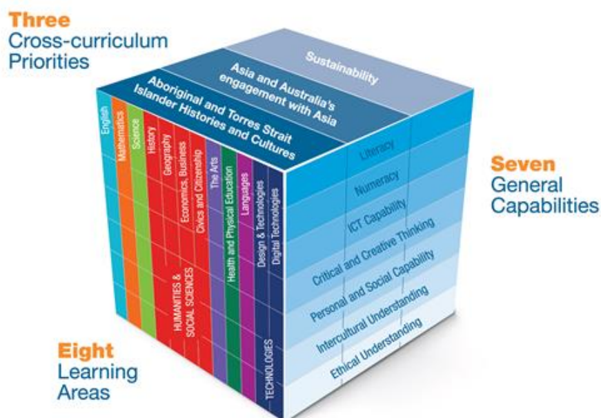
Fíor 3 - Australian Curriculum [Curaclam F-10 na hAstráile] (Curaclam ón mBunrang go Bliain 10)

Tá achoimre de Churaclam F-10 Australian Curriculum for Foundation to Year 10 (F-10 Curriculum) (aoiseanna 5-16), i bhFíor 3 thuas, lena n-áirítear Inbhuanaitheacht mar thosaíocht traschuraclaim, a dtugtar fúithi i ngach ceann de réimsí foghlama an churaclaim. Tá sé eagraithe thar cheithre príomhchoincheap de chórais, dearcadh ar an domhan, deardh, agus todhchaíocha, agus tugtar tuilleadh sonraí orthu trí ghrúpa de smaointe eagrúcháin.