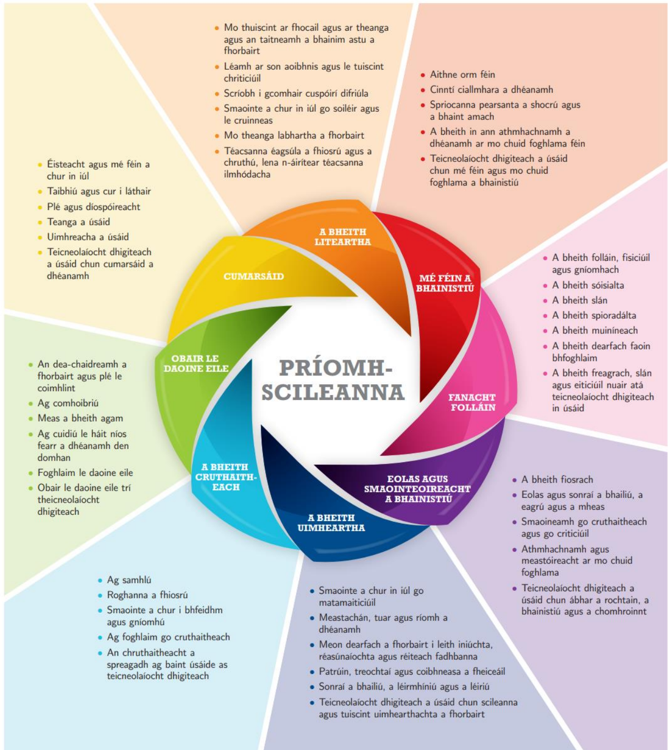
Fíor 1: Príomhscileanna na sraithe sóisearaí

I dteannta lena n-inneachar agus eolas sonrach, cuireann ábhair agus gearrchúrsaí na sraithe sóisearaí deiseanna ar fáil do scoláirí réimse príomhscileanna a fhorbairt. Dírionn curaclam na sraithe sóisearaí ar ocht bpríomhscil a leagtar amach thíos.