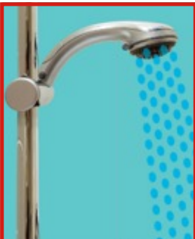
Pictiúr G – Cíthholcadh

Tá go leor línte lipéid féideartha le haghaidh gach pictiúr. Bain úsáid as lionsaí Súile Mata difriúla agus smaoinigh ar línte lipéid difriúla. Cuirfidh na línte lipéid is fearr daoine ag féachaint ar gach pictiúr chun an mhatamaitic a fheiceann tusa le do Shúile Mata a fheiceáil. Is féidir le línte lipéid réiteach fadhbanna agus réasúnaíocht a spreagadh agus ba cheart dóibh a bheith spráúil.