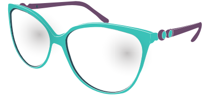
Tábla 1: Lionsaí Súile Mata s

Sa tslí chéanna a chabhraíonn lionsaí tadhaill nó spéaclaí le roinnt daoine feiceáil níos soiléire, is féidir le 'Súile Mata' cabhrú linn saghsanna difriúla matamaitice inár dtimpeall a fheiceáil. Nuair a fhorbraíonn duine a Súile Mata ar dtús is gnáth go bhfeiceann siad an mhatamaitic a bhaineann le tomhas nó le huimhreas m.sh., praghsanna sa siopa, uimhreacha cláraithe busanna agus carranna, barrachóid, comharthaí luais, srl srl. sula bhfeiceann siad saghsanna difriúla matamaitice. Mar sin féin, tríd an lionsa trína fhéachann tú a athrú is féidir saghsanna matamaitice eile san fhíorshaol atá inár dtimpeall a fheiceáil. Tugtar breac-chuntas ar na nithe a d'fhéadfá a fheiceáil trí úsáid a bhaint as lionsaí difriúla i dTábla 1.