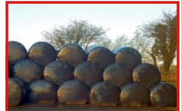
Pictiúr C – Burlaí Sadhlais