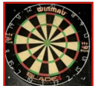
Pictiúr D – Clár Dairteanna