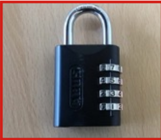
Pictiúr H – Glas Teaglana