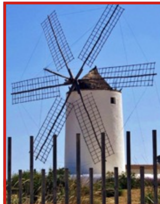
Pictiúr F – Muileann Gaoithe