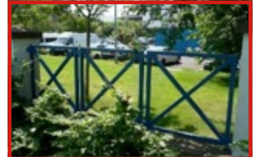
Pictiúr B – Ráillí