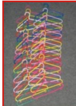
Pictiúr E – Crochadán