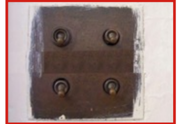
Pictiúr A – Lasca Solais