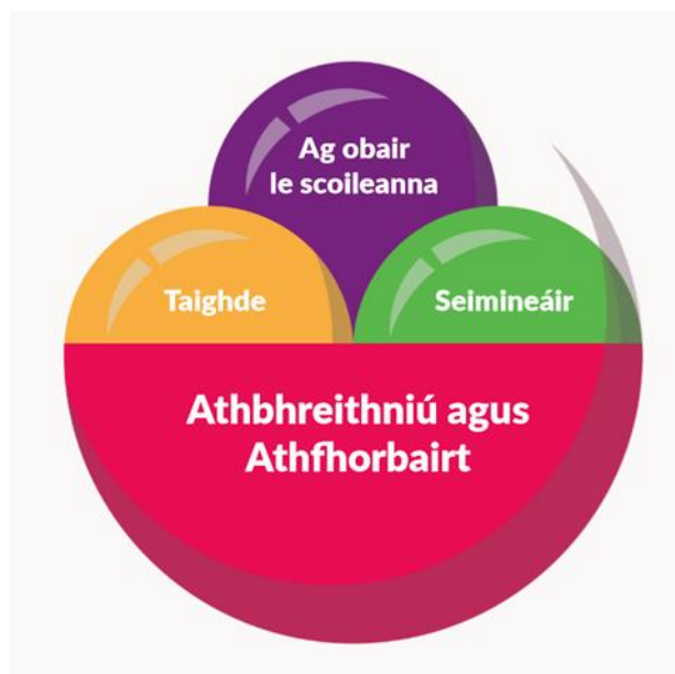
Figiúr 1: Na trí shnáithe d'athbhreithniú agus athfhorbairt ar an gcuraclam

Baineann obair an CNCM an-leas as taighde agus, ar an ábhar sin, scríobh taighdeoirí náisiúnta agus idirnáisiúnta sraith de pháipéir thaighde ghearra maidir le príomhghnéithe curaclaim bunscoile athfhorbartha. Tugtar tacaíocht sna páipéir thaighde seo do rannpháirtíocht san athbhreithniú agus san athfhorbairt ar churaclam na bunscoile. Is féidir teacht ar na páipéir thaighde anseo . Táimid ag obair chomh maith le bunscoileanna, iar-bhunscoileanna agus