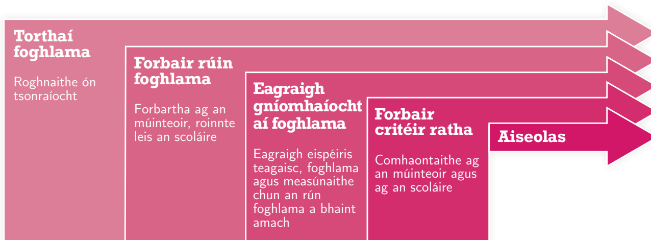
Figure 1: Ag pleanáil an teagasc, an fhoghlaim agus an measúnú

Le torthaí foghlama , cuirtear na hábhair tógála ar fáil don mhúinteoir chun an teagasc, an fhoghlaim agus an measúnú a phleanáil. Is féidir leis an múinteoir rúin foghlama agus critéir ratha a úsáid ansin chun an phleanáil a thabhairt céim ar aghaidh agus beocht a chur sna torthaí foghlama i gcleachtas leis an scoláire.