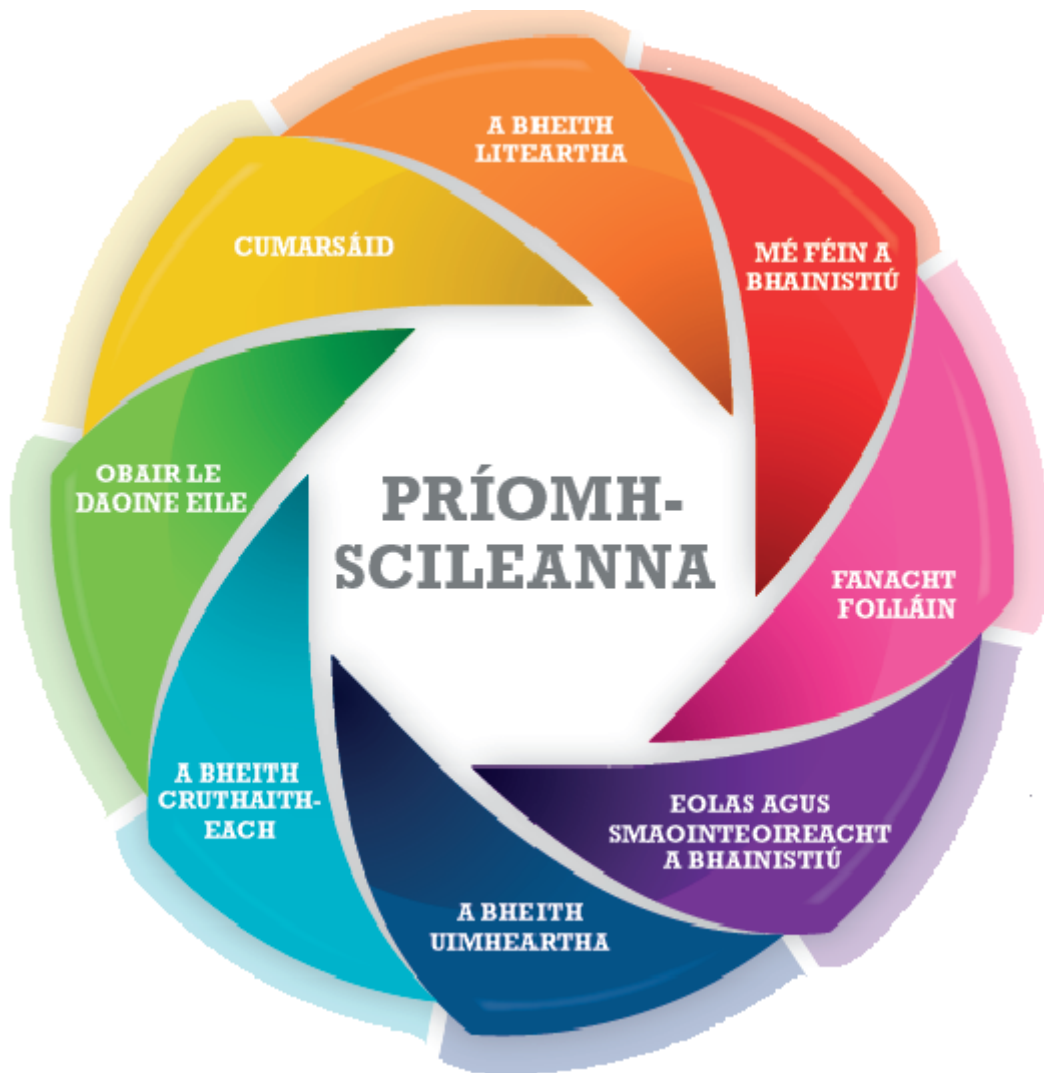
Fíor 1: Ocht bpríomhscil na sraithe sóisearaí agus a gcuid gnéithe

I dteannta a n-inneachair agus a n-eolais shonraigh, tugann ábhair agus gearrchúrsaí na sraithe sóisearaí deiseanna don scoláire chun réimse leathan príomhscileanna a fhorbairt. Léiríonn Fíor 1 thíos príomhscileanna na sraithe sóisearaí. Tá deiseanna ann chun tacú leis na príomhscileanna uile sa chúrsa seo ach tá roinnt díobh a bhfuil tábhacht ar leith leo.