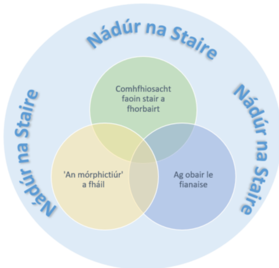
Fíor 2: Na gnéithe de Shnáithe a hAon: Nádúr na Staire: Snáithe aontach

Tá an struchtúr sin ag teacht le cur chuige neamhlíneach maidir le dul i ngleic le torthaí foghlama. Níl sé i gceist go dtabharfadh an scoláire faoi Shnáithe a hAon mar aonad scoite sula dtabharfaidh sé faoi Snáitheanna a Dó agus a Trí. Ina ionad sin, tugtar an comhthéacs don scoláire i Snáitheanna a Dó agus a Trí a thuiscint ar nádúr na staire mar dhisiplín a dhoimhniú.