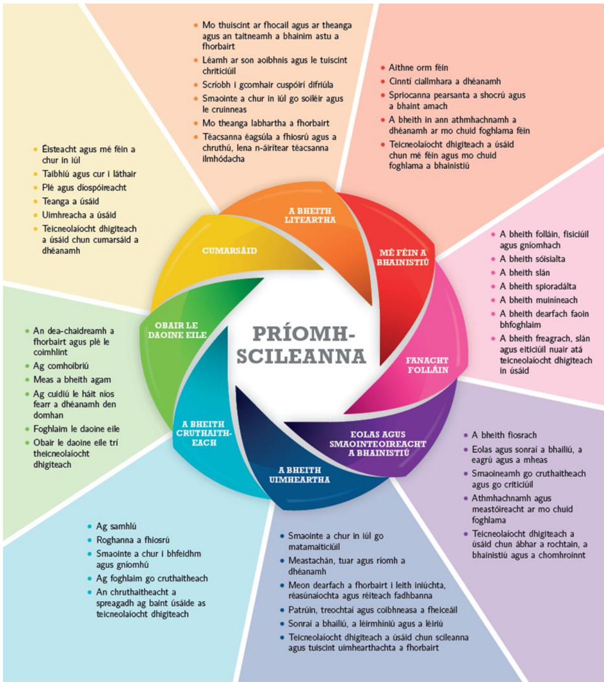
Fíor 1: Príomhscileanna na sraithe sóisearaí

Díríonn curaclam na sraithe sóisearaí ar ocht bpríomhscil: